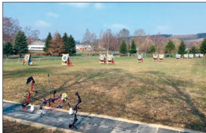
Abb. Trainingsgelände Schönfeld

Für Fragen stehen außerdem Tino Hofmann ( tino641@freenet.de ) und Frank Lorenz (Tel. 0179/2933925) gern zur Verfügung. Am 21. September 2019 findet zum 25-jährigen Bestehen unseres Vereins auf dem Trainingsgelände in Schönfeld eine Vereinsfeier statt, zu der alle Interessenten herzlich eingeladen sind.