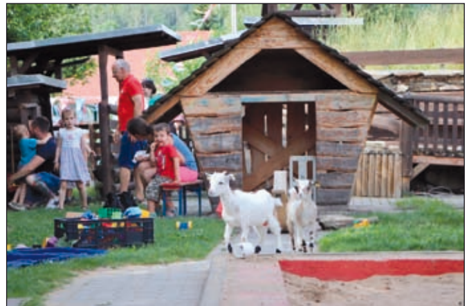
Eine besondere Einlage boten unsere kleinen Ziegen.