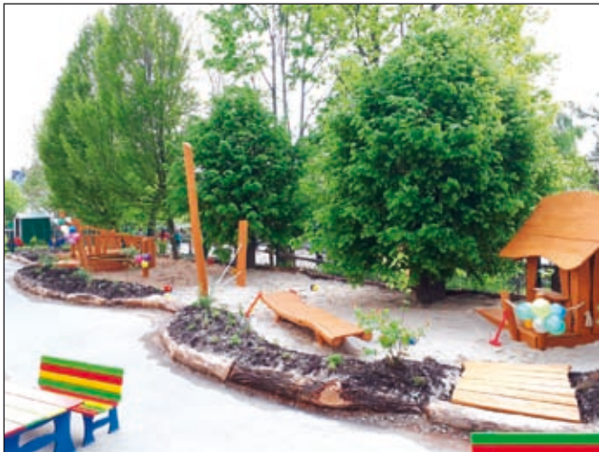
Genießt den Sommer und bleibt schön neugierig. Die Sonnen vom „Sonnenhügel“