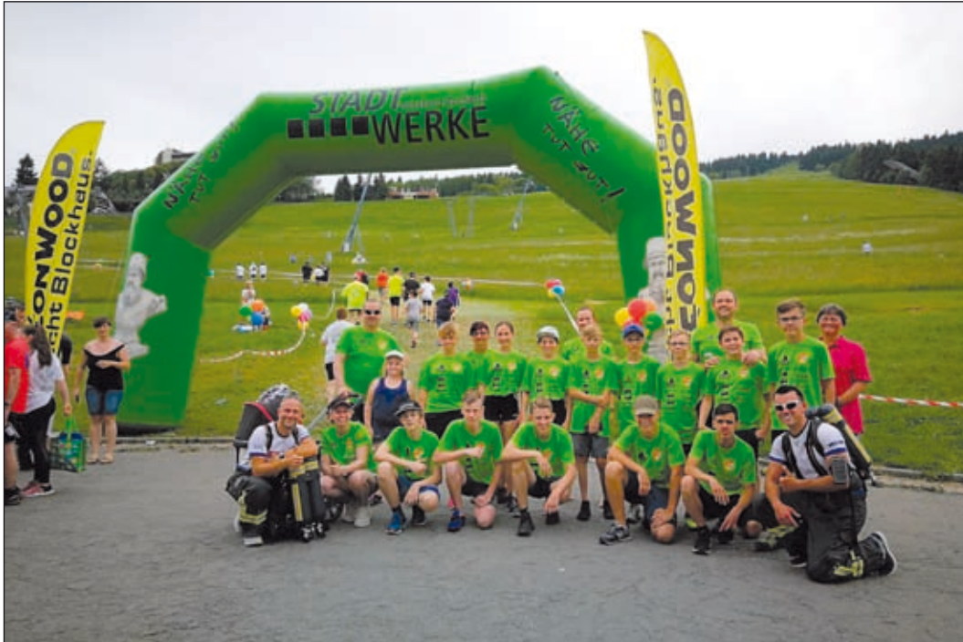
Läuferteam der Jugendfeuerwehr und Feuerwehr zum Benefizlauf 2019