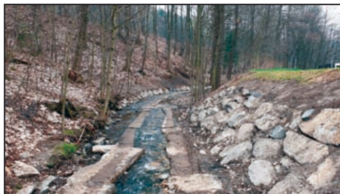
Teilabschnitt Bereich Tankstelle