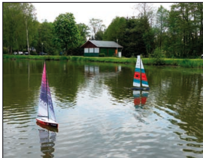
Segelboote auf dem Weberteich

Für Anfänger sind Schiffsmodelle zum Selberfahren vorbereitet. Auch zum Fachsimpeln ist Gelegenheit vorhanden.