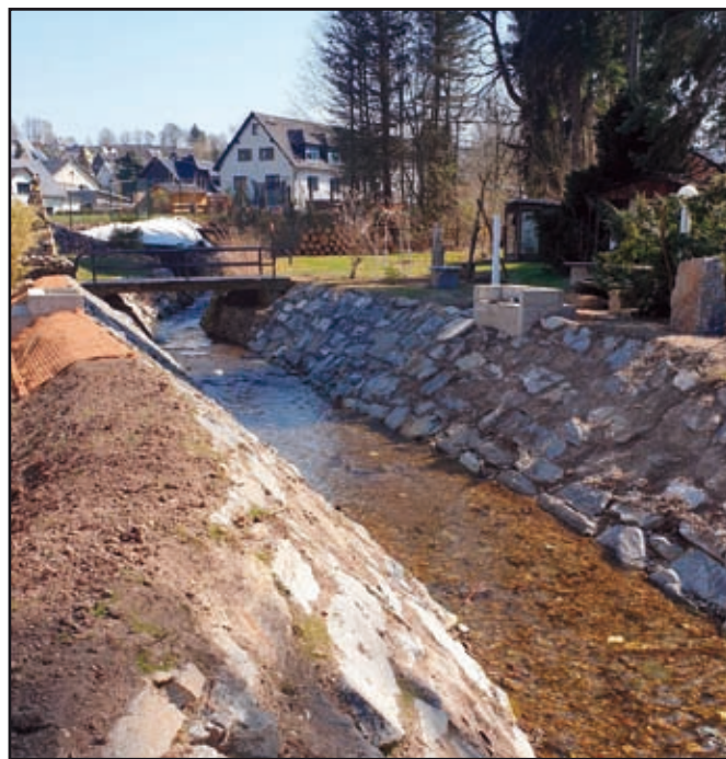
Teilabschnitt hinter der Firma STB Straßenbau GmbH