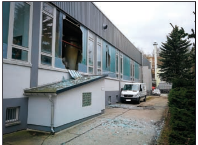
Explosion im Gewerbegebiet Panther

Die Wucht der Explosion war so heftig, dass es sogar eine Tür aus der Verankerung gehoben hat. Es wurden einige Arbeiter dem Rettungsdienst vorgestellt, dieser konnte aber Entwarnung geben.