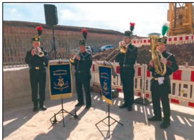
Bläserquartett des BMV

Dieser Tunnel gehört zur Autobahn A44 und ist der Abschnitt von Kassel bis zum geplanten Ende an der A4 westlich von Eisenach. Damit kann man bei Fertigstellung von der A4 über die A44 direkt den Bereich des Ruhrgebietes bis zur deutsch-belgischen Grenze bei Aachen erreichen.