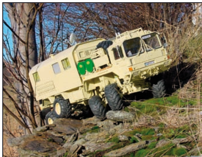
MAN-LKW im Gelände