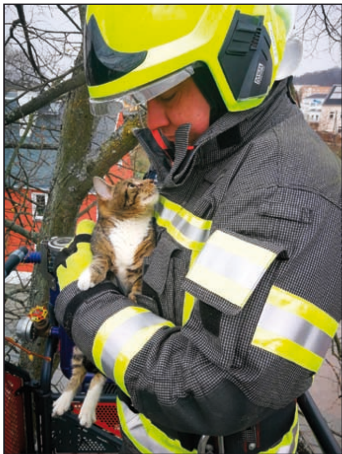
Rettung einer Katze

Am 13. April wurden wir von Bewohnern darauf aufmerksam gemacht, dass seit einigen Tagen eine Katze auf einem Baum an der Wettinstraße – Kastanienstraße festsetzen würde. Mit unserer Drehleiter konnten wir sie ohne jegliche Gegenwehr aus ihrer misslichen Lage retten.