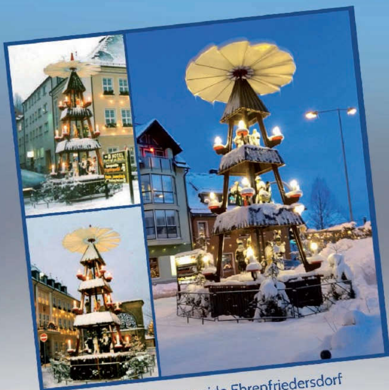
50 Jahre Ortspyramide Ehrenfriedersdorf

Eine frohe und besinnliche Advents- und Weihnachtszeit sowie einen guten Start in das neue Jahr wünschen Ihnen die Bürgermeisterin und die Mitglieder des Stadtrates sowie alle Mitarbeiterinnen und Mitarbeiter der Stadtverwaltung